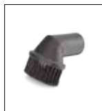
Spazzola a setole morbide