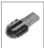
Spazzola per termosifoni