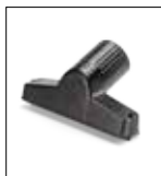
Spazzola per tessuti