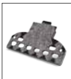
Base filtro per spazzola M29