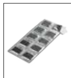
Strip profumatori (10pz)