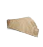
Sacchetti aspirazione (10pz)