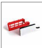
Filtro spugna carboni attivi