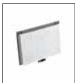
Filtro carboni attivi