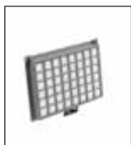
Filtro S-Class HEPA